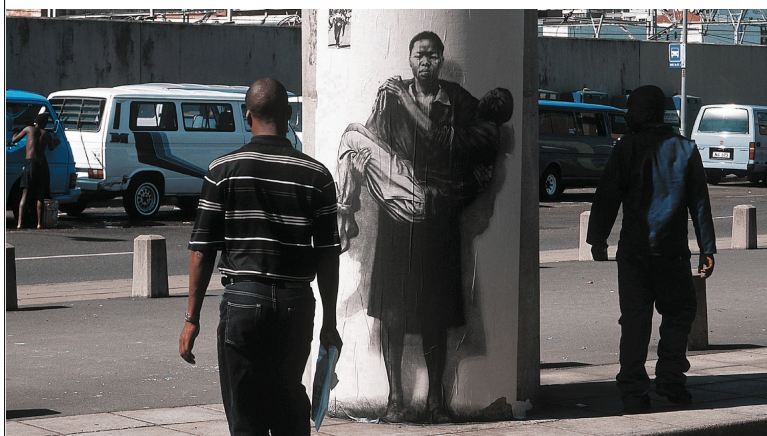
Soweto- Warwick, photographie, 2002.